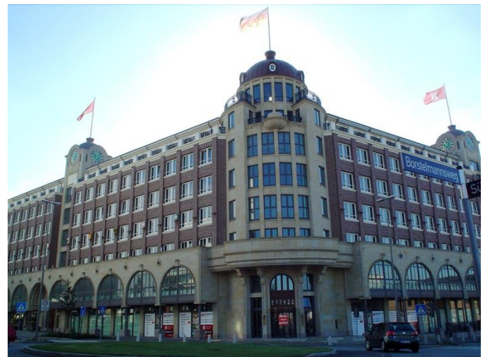
intellivate GmbH im Störtebekerhaus in Hamburg

Die intellivate GmbH hat sich darauf spezialisiert, Unternehmensprozesse aller Art durch Know-how und Software Werkzeuge schlanker, robuster und damit effizienter zu machen. Wir helfen Ihnen, Ihr Daten- und Prozessmanagement als "Wirtschaftsgut Information" zu verstehen, dieses auf eine neue Arbeitsebene zu heben und schließlich die Zusammenarbeit, den Informationsaustausch und damit die Produktivität Ihrer Mitarbeiter und Anlagen zu verbessern.